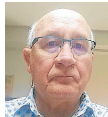
JUAN MARÍ OLLORA

Consejero de Economía y Hacienda del Gobierno vasco (1980-1984). Presidente de la Comisión Negociadora Vasca del Concierto Económico de 1981.