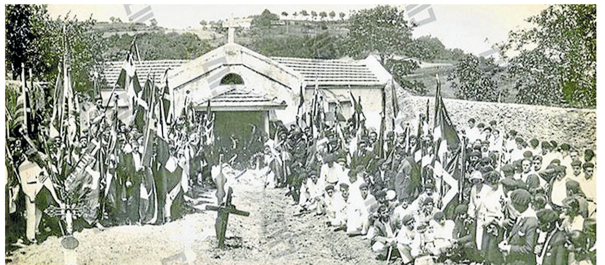
El cementerio de Sukarrieta, donde fue enterrado Sabino Arana, se convirtió en un lugar de peregrinación para el nacionalismo.