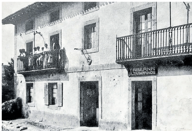
Residencia de Sabino Arana durante el último año antes de contraer matrimonio, que se convertiría en el batzoki de Sukarrieta.