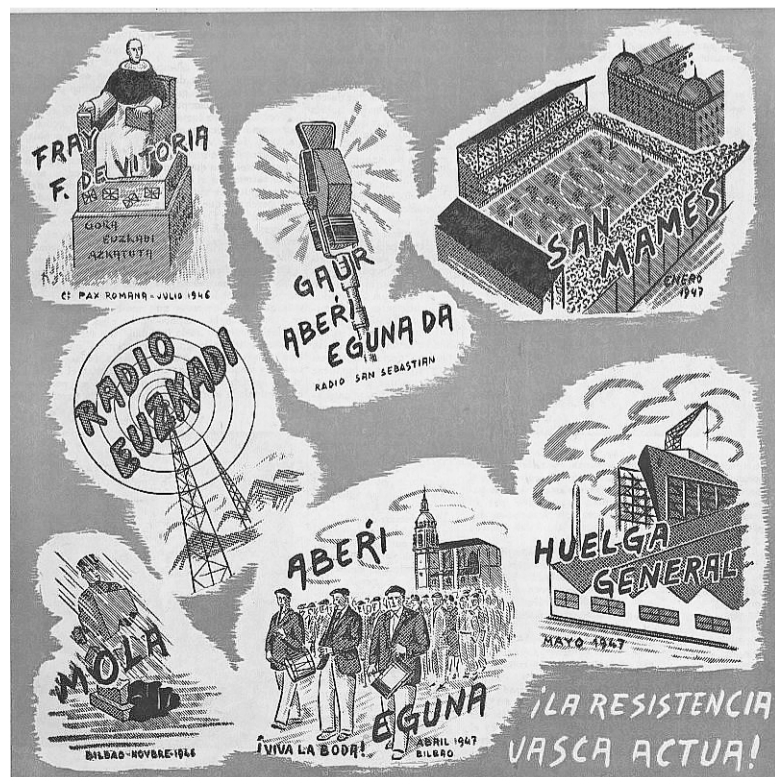
Euskal erresistentziaren ekintzak irudikatzen zituen 1947ko kartela.

zituen euskal demokratek elkartzeko, bai eta espainiar errepublikazaleen arteko ezinikusiak eta aldeak arintzeko ere. Lan horretan, Agirre lehendakariak hamaikaxo ahalegin egin zituen adostasunak ontzen, kasurako, euskal alderdi eta sindikatuen artean sinatutako Baionako ituna eta Errepublikako Gobernuaren eratzeko burutu zituen ekimenak. Agirreraren asmoa honetara laburtu zitekeen: baztertu ditzagun banatzen gaituzten aldeak, elkar hartuta kanporatu dezagun Franco, eta geroago izango dugu astia eta aukera denontzako demokrazia adosteko.