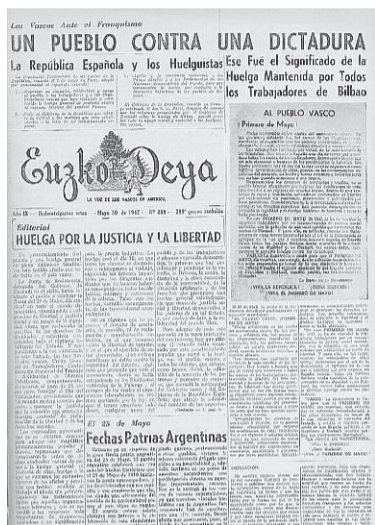
Grebaren oihartzuna zabaldu izan zen mundu osoan. Irudian Argentinako euskal prentsan ageri zen albisteetako bat.