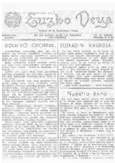
Klandestinoki zabaltzen zen 'Euzko Deya'-n grebaren berri.

tela egiaztatzea, arrakastatsua izan zen.