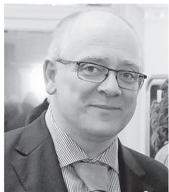
Historian lizentziatua. Sabino Arana Fundazioko Abertzaleatasunaren Agiritegiko teknikaria.

potentzia guztiek demokratikoa ez delako eta eroritako faxismoari lotuta egon zelako kondenatzen duten erregimen baten kontra altxatu besterik ez dugu egin euskaldunok. (...) Gure herri altxamenduan, badira askatasunaren aldeko benetako mugimendu baten oinarri positiboak, edozein motatako tirania akabatu nahi dutenak".