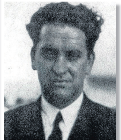
Irujo, presidente del Consejo.

H OY se cumple el 75 aniversario de la constitución del Consejo Nacional de Euzkadi, institución efímera y poco recordada, pero surgida en un crucial momento en la Historia del País Vasco cuya desaparición definitiva parecía más que una posibilidad casi una certeza, tras la derrota frente al fascismo que se adueñaba de Europa.