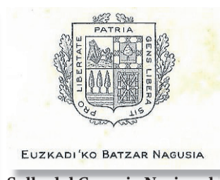
Sello del Consejo Nacional.