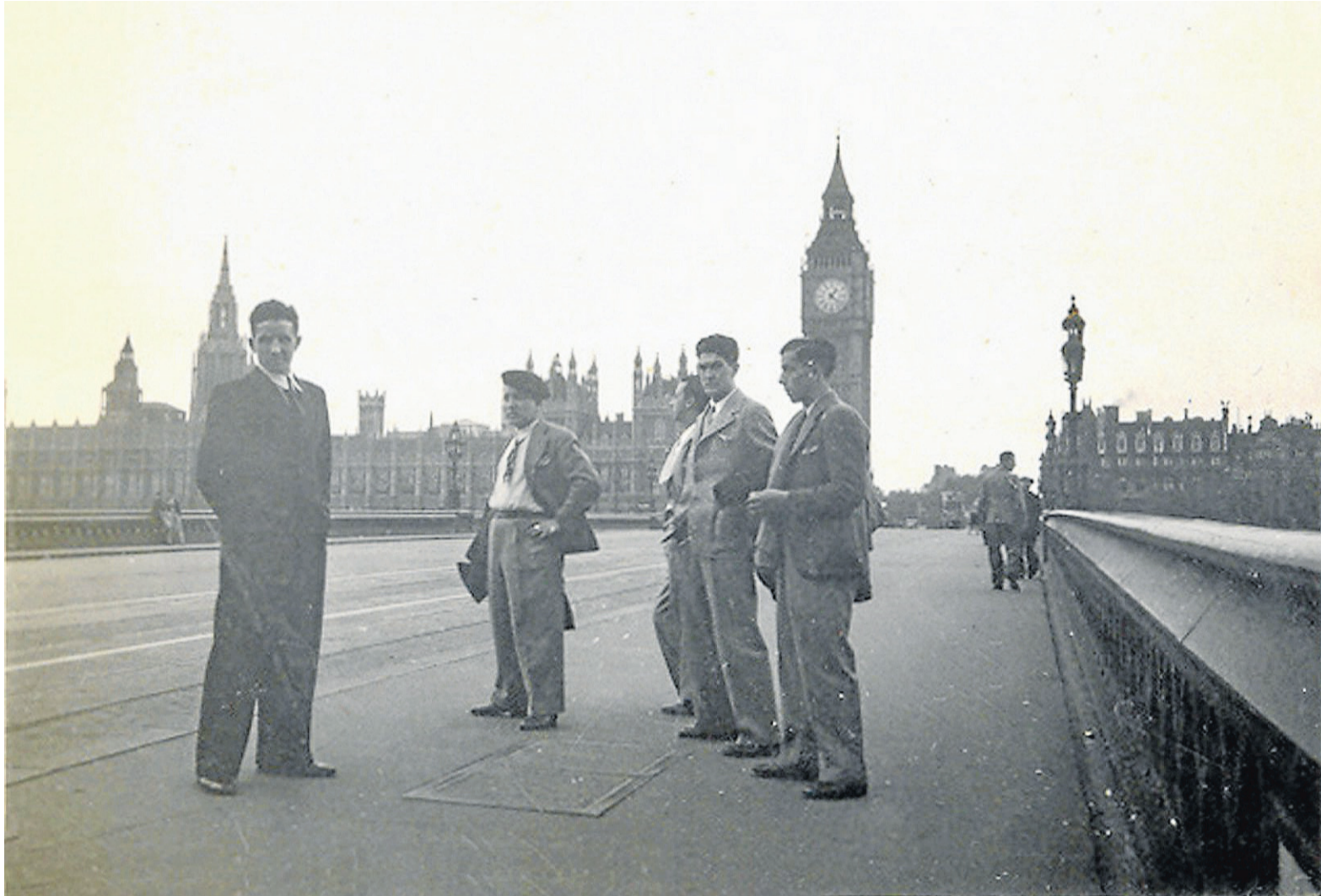
Componentes de Eresoinka en Londres, sede del Consejo Nacional de Euzkadi.