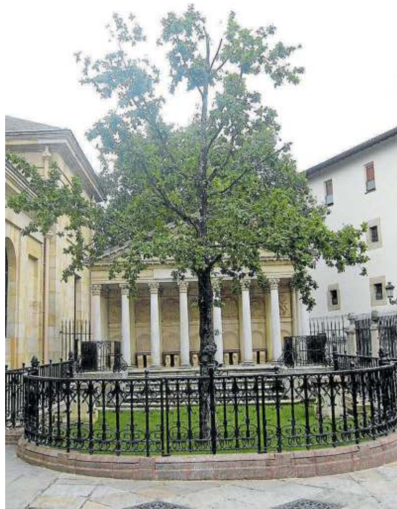
El Árbol de Gernika, símbolo de la foralidad vasca.

Como veremos a continuación, esta interpretación ponía en riesgo