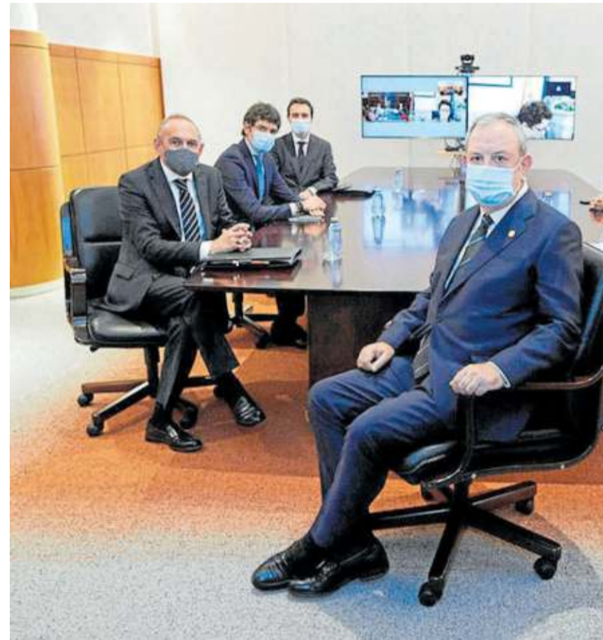
Reunión de la Comisión Mixta durante la pandemia, en 2020.

el autogobierno (y la capacidad de hacer frente a una pandemia asumiendo el riesgo unilateral), ya que chocaba con la naturaleza jurídica y competencial de las instituciones forales, pudiendo provocar que el sistema de Concierto fracasara en su misión de acceder a todas las vías de financiación que le corresponden.