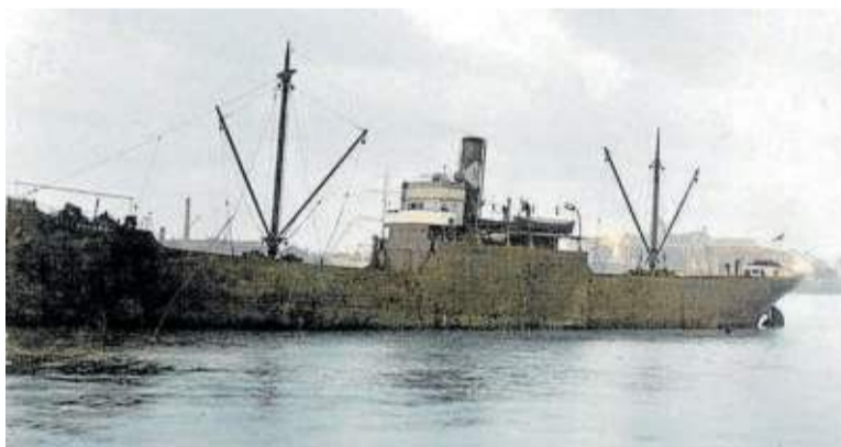
Buque alemán 'Hochheimer'.

Carta conmemorativa del centenario de la creación de la flota submarina británica, con la historia del 'HMS Sceptre' y la firma de su comandante en 1943.