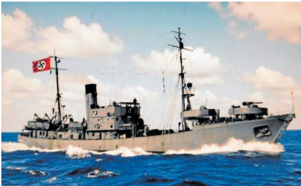
Patrullera alemana 'V-408 Hantelbank'.

El Blackfish lanzaría dos torpedos desde sus tubos de proa contra el barco que iba en cabeza y otros dos contra el segundo. La segunda embarcación, la patrullera camuflada V-408 Haltenbank , de 445 toneladas, sufrió un impacto fatal que la llevó al fondo del mar, siendo el submarino inmediatamente atacado con cargas de profundidad por parte del otro navío. Hubo 34 supervivientes quienes principalmente fueron evacuados hacia Santander. Mientras el submarino se sumergía, explotaron cinco bombas y cuatro cargas de profundidad, de las doce que lanzó el V-404 Vaden , una de ellas detonó muy