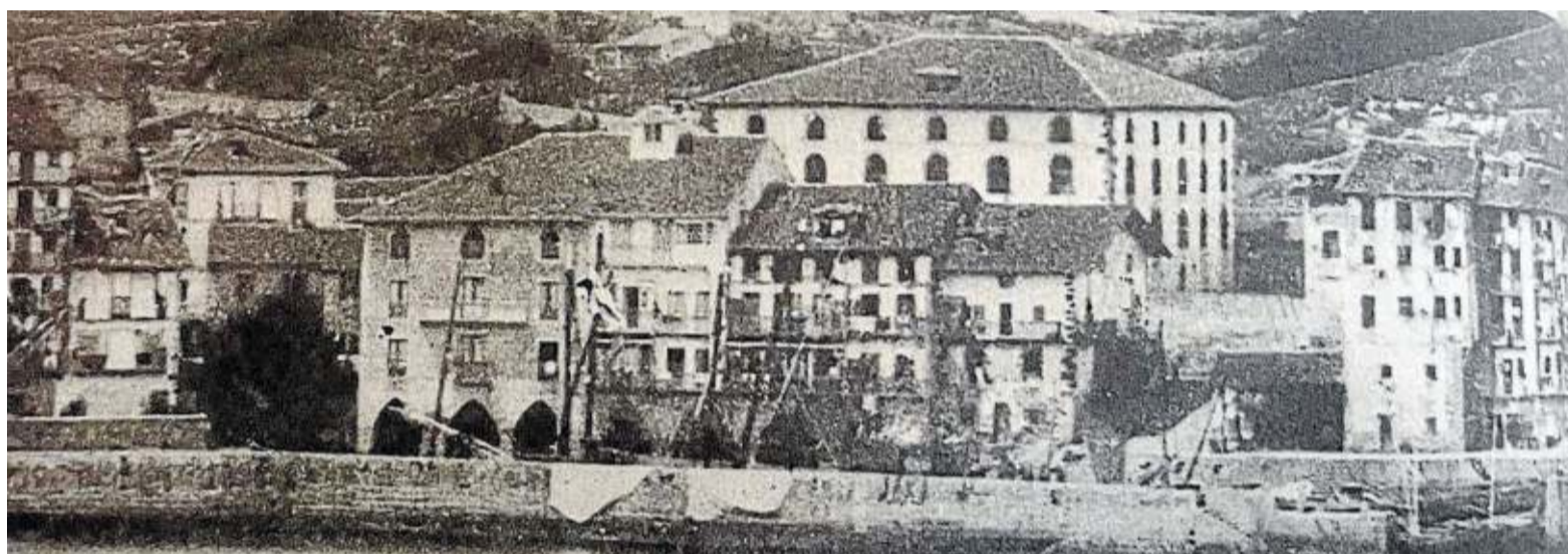
Imágenes del puerto de Lekeitio tras la guerra.