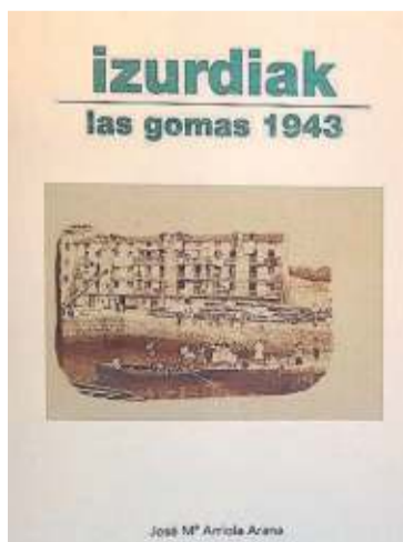
Cubierta del libro 'Izurdiak - Las gomas 1943' en la que se refleja la llamada 'Batalla por el caucho'.

en su momento fue vital para la economía de los puertos pesqueros de Bizkaia. En el mismo se hace un estudio exhaustivo e históricamente exacto en cuanto a las descargas en los puertos de Elantxobe, Lekeitio y Ondarroa, al haber podido contar con todo el Expediente Oficial abierto en la Ayudantía de Marina de Lekeitio, hoy en el Archivo Foral de Bizkaia. Es una lástima que falte toda referencia al otro gran puerto de descarga, que fue Bermeo. La posición de privilegio de los puertos pesqueros de Bizkaia en el hallazgo de las gomas se explica por la utilización del euskera en las comunicaciones por radio entre los barcos, idioma que desconocían los marineros de otros puertos de Cantabria, Asturias