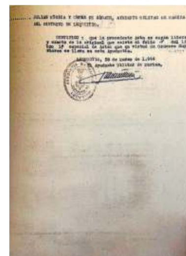
Acta de Recepción de los fardos abierta a cada uno de los barcos en el momento de la entrega.

En 1943 unas dos mil toneladas de goma virgen fueron ‘pescadas’ por varios buques vizcainos cerca de Matxitxako después de una batalla naval de la II Guerra Mundial