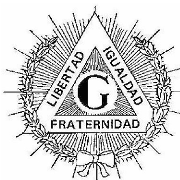
Triángulo con la ‘G’ simbólica. Ilustración decorativa.