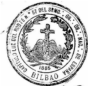
Sello del Capítulo Luz del Norte 57 de Bilbao.

varón de la orden, en la práctica operaban como logias independientes con total libertad. Cabe destacar a Concepción Arenal, defensora de la