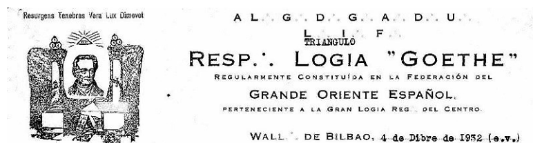
Sello y membrete de la Bilbaína Logia Goethe -triángulo- y su lema ‘Resurgens Tenebras Vera Lux Dimovet’.