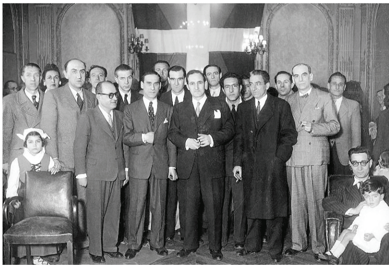
Recepción en II Av. Marceau, sede del Gobierno vasco en París, durante la celebración del Aberri Eguna de 1945.

También plantea el hecho nacional vasco, afirmando que Sabino Arana devolvió a Euskadi la conciencia de su personalidad y le otorgó para su defensa argumentos que aunque lógicos habían sido hasta entonces inéditos. Considera que tras el hacer político vino el renacimiento cultural y la lengua venía a ser estimada como motivo de preferencias nacionales. La literatura, el folklore, el arte vasco en todas sus manifestaciones volvieron a ponerse de moda y en las