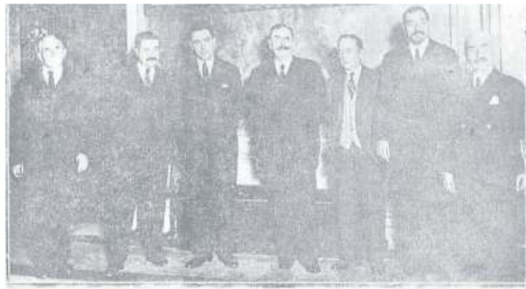
Nombramiento de concejales representantes de Deusto y Begoña en el Ayuntamiento de Bilbao. 'El Noticiero Bilbaino', 22-11-1925.