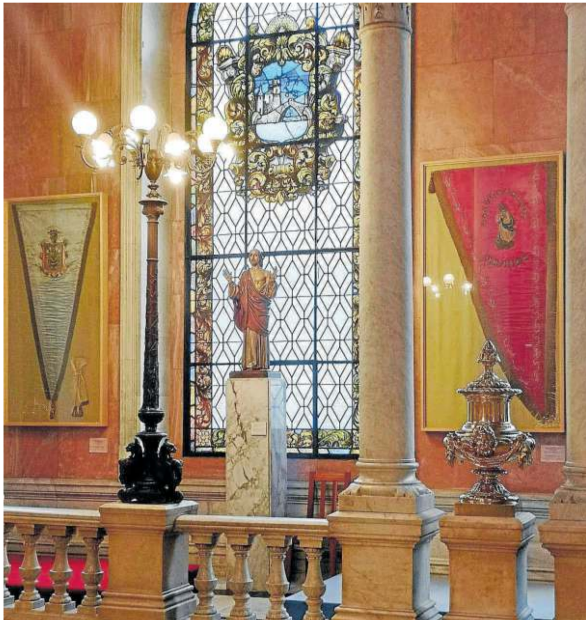
Pendones de las Repúblicas de Begoña y de Abando en el Ayuntamiento de Bilbao.