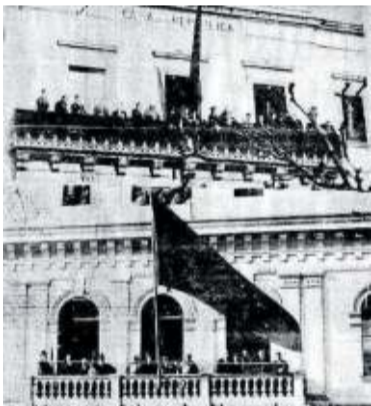
Anexión de Deusto y Begoña. 'El Noticiero Bilbaino', 01-01-1925.

Gracias a la documentación conservada en el Archivo Histórico de Bizkaia y en el Municipal de Bilbao hemos conocido, con mayor detalle, la anexión de Begoña a la villa, y a uno de sus protagonistas que, en los escasos once meses de presidente en la Junta Vecinal defendió los intereses territoriales y patrimoniales de la extinta anteiglesia, convertida en el cuarto Distrito de Bilbao. ●