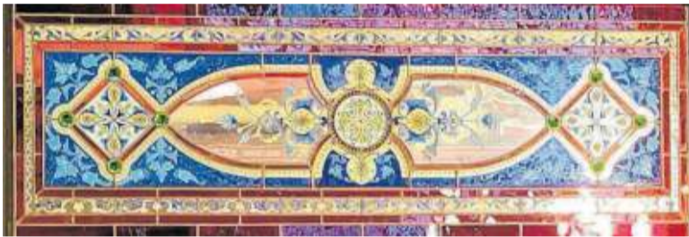
Cristales de colores de la Cristalería del Belga en vanos y puertas del Consistorio bilbaino, 1890.