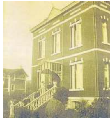
Villa Amadeo, en Santutxu, Begoña (1903).

Lamiaco para la fabricación de vidrio plano, importando de su país natal la tecnología y mano de obra cualificada. Una colonia, la belga, de la que el artista Guiard decía: "Las belgas para hacer dulce, arrapaban toda la mora, teniendo el chimbo que emigrar (...) falto de su pasto natural", aunque nos inclinamos a pensar que los chimbos bilbainos y sus chimberas tuvieron algo más que ver con dicha desaparición.