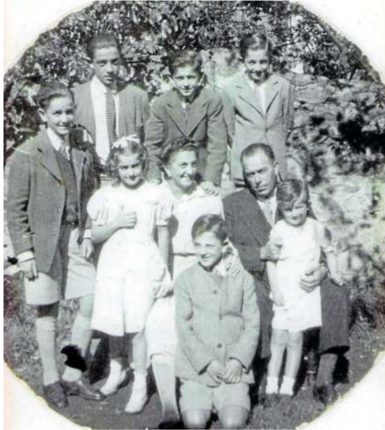
Familia Deprit Navea, en Begoña.