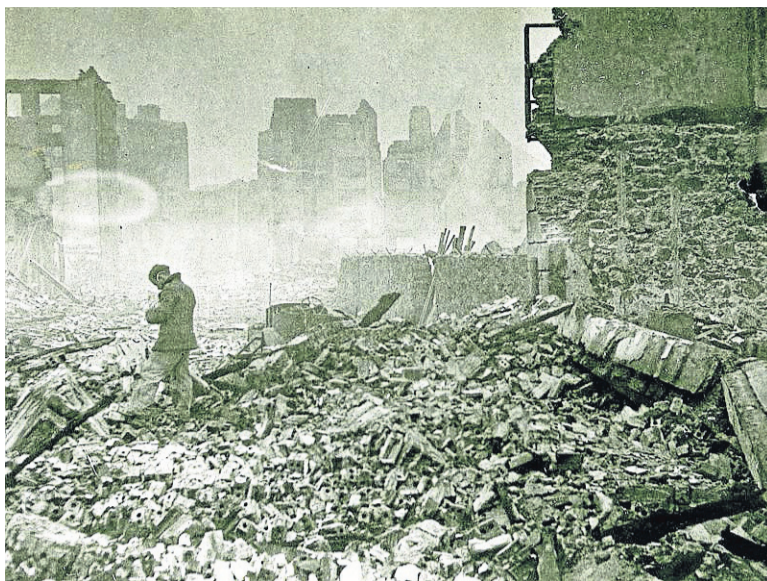
Elosegi camina entre los escombros de Gernika tras el bombardeo.