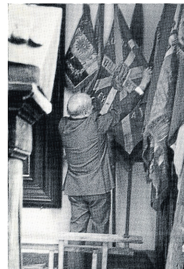
Recuperando la ikurriña del Museo del Ejército español.

morir por algo. Que comenzaba también con una expresiva frase: "Gernikako sua eraman nahi dut, haren erretzailearen begietaraino". (Quiero llevar el fuego de Gernika a los ojos de su incendiario). Los breves títulos de sus capítulos revelaban, aparte del contenido de la obra, una gran claridad expositiva: Camino de mi hora. El fuego de Gernika. España