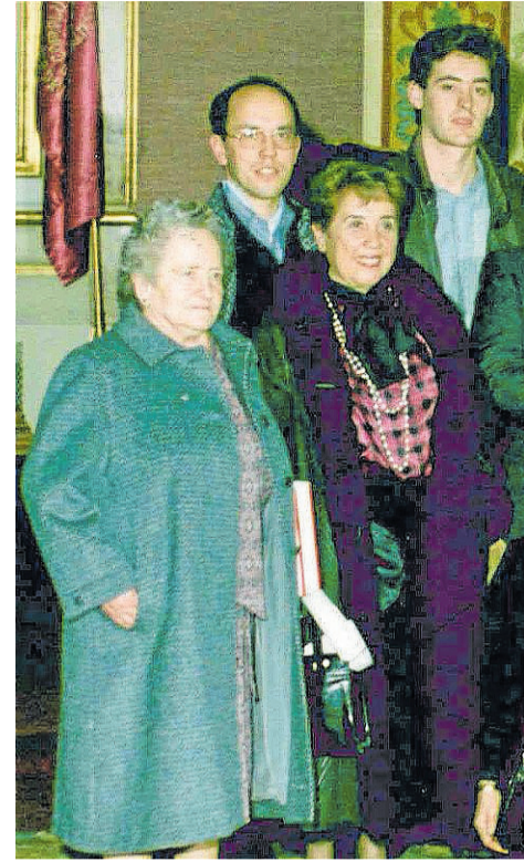
Doctorado Honoris Causa de la zantes vascos, entre ellos, arriba

A HORA que se recurre tanto a la memoria histórica no estará de más que traigamos a nuestro recuerdo a don José Miguel de Barandiaran, que sin duda fue una de las personalidades más eminentes de nuestro pueblo en el siglo XX. Son días apropiados estos que transcurren al comenzar el año. Nació el último día de 1889 y murió en el solsticio de invierno, 21 de diciembre, de 1991. Le faltaban diez días para cumplir 102 años. Vivió todas las vicisitudes del siglo XX y, a la vez que testigo, fue un agente de primer orden en la promoción de la cultura vasca.