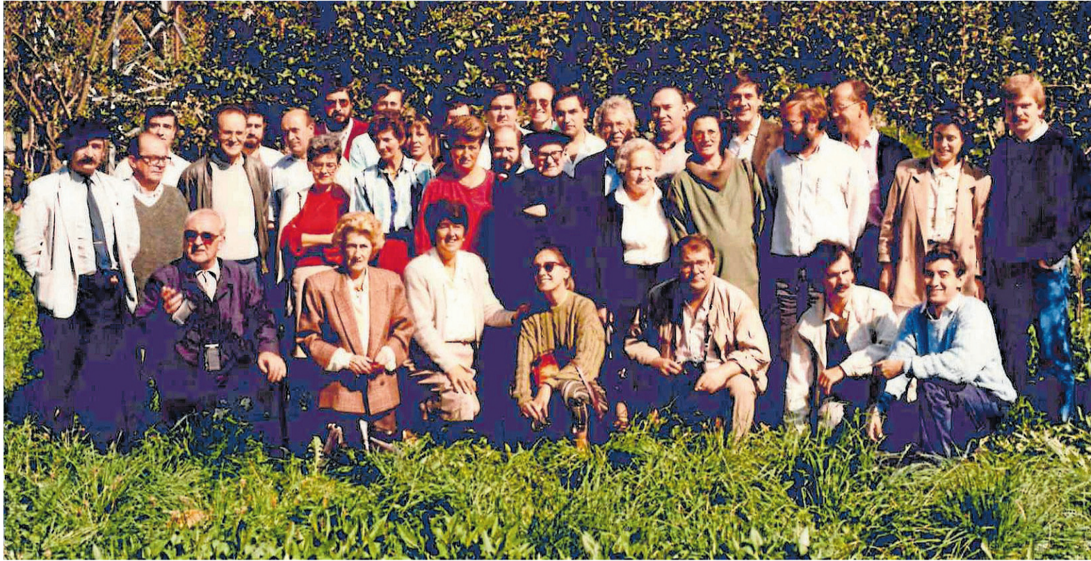
Reunión plenaria de los Grupos Etniker Euskalerrria con Barandiaran. Ataun, 1988.