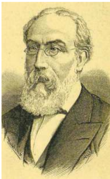
Francesc Pi i Margall.