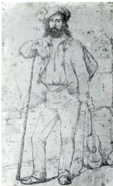
Jose Mª Iparragirre.