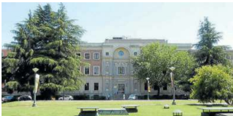
Fachada del Archivo Histórico Nacional de Madrid.