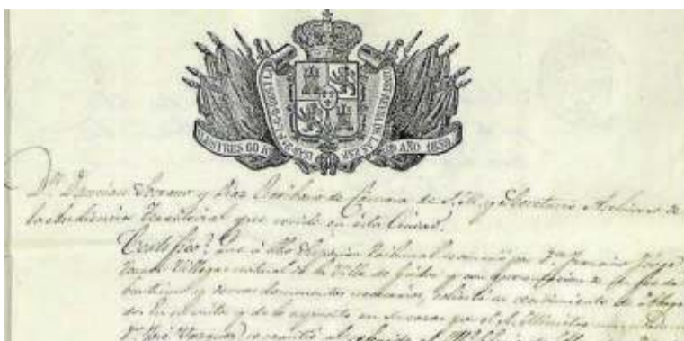
Detalle del documento del Archivo Histórico Nacional.