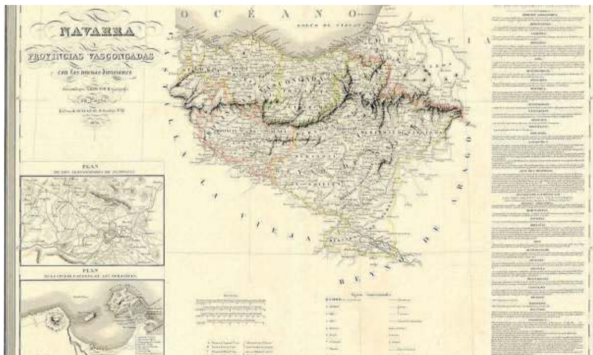
Mapa del geógrafo Auguste-Henri Dufour realizado en París en 1836.