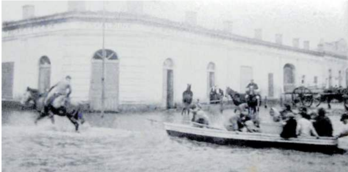
Almacén de ramos generales de Nemesio de Olariaga durante una inundación (Maipú, provincia de Buenos Aires, Argentina, 1913)

La agrupación desplegó una intensa actividad: distribuyó obras de Sabino Arana, organizó una comisión para conseguir empleo a los