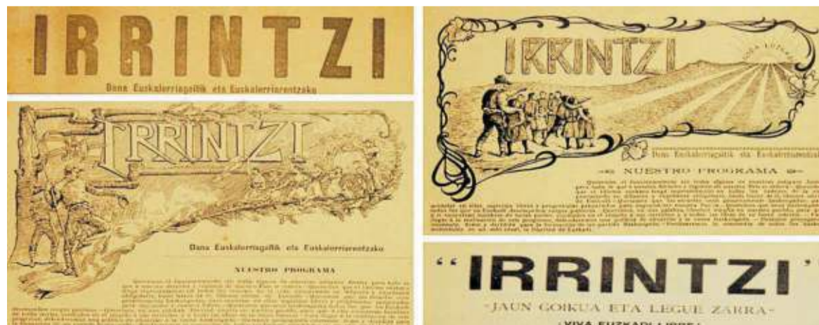
Diferentes portadas de ‘Irrintzi’ entre 1903 y 1923.

Los resultados de aquella primera etapa fueron modestos pero significativos. La propuesta identitaria que Irrintzi intentó promover —la de