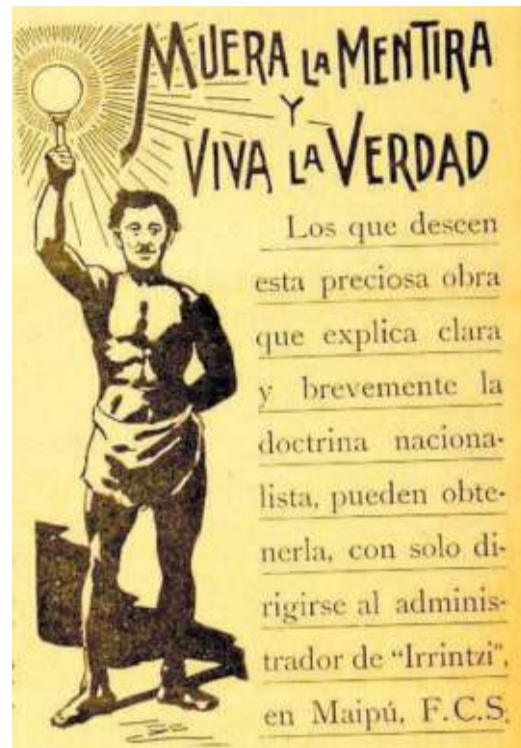
Propaganda de Ami Vasco en 'Irrintzi' (1908)