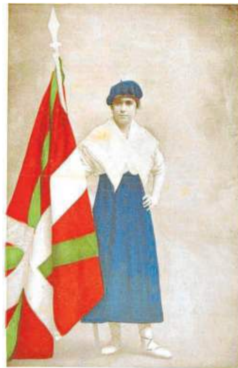
Mujer con una ikurriña en 'Irrintzi' (1917).