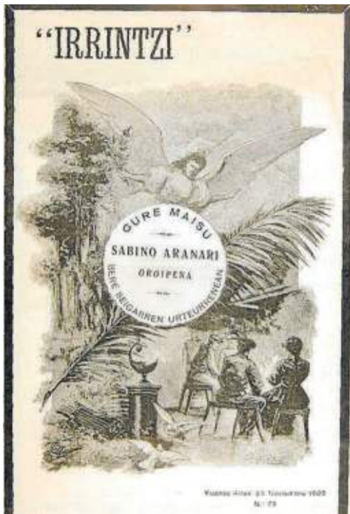
Portada del número 79 de 'Irrintzi', dedicado al sexto aniversario de la muerte de Sabino Arana (1909)