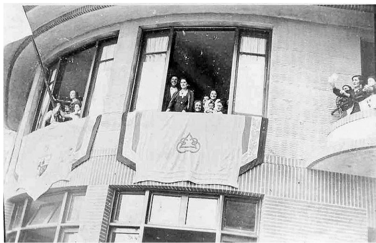
Día de la inauguración del batzoki de Bermeo.