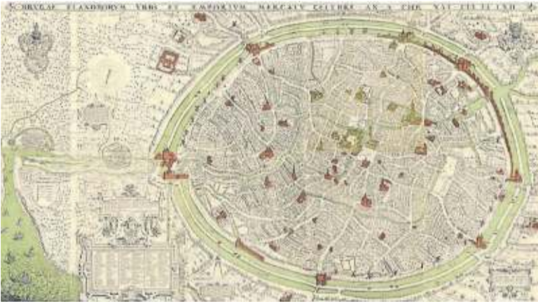
Plano de Brujas elaborado por Marcus Gheeraerts (1562).