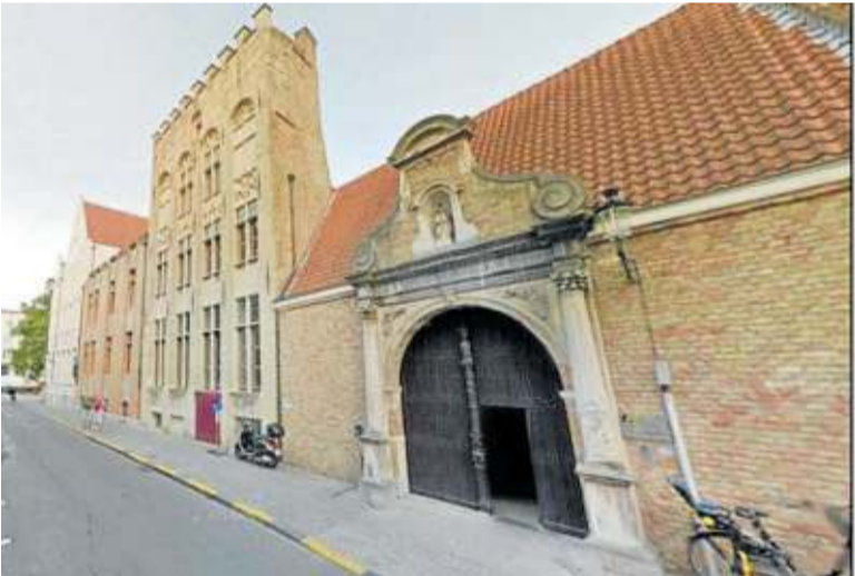
Restos de la Casa de los castellanos en Brujas.

Toda esta competencia que en este artículo focalizamos en la ciudad de Brujas por su importancia comercial entre Burgos y Bilbao fue la que dio lugar a la creación de sus propios