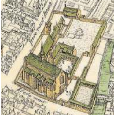
Convento franciscano de Brujas.

consulados, primero en 1494 el de la ciudad de Burgos, y en 1511 el de la ciudad de Bilbao, inspirado en el anterior. En cualquier caso, lo hasta aquí descrito no deja de ser un resu-