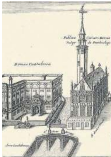
Casa de la Nación de Bizcaya en Brujas (1641).

Como muestra de esto fue el enfrentamiento por la gestión de la capilla de Santa Cruz del convento de los franciscanos, “de los frailes menores”, de Brujas, que fue motivo de controversia también entre los propios hispanos. La lucha establecida entre el consulado de Castilla y el consulado de Bizkaia por el patronazgo de la capilla, donde cada uno había colocado sus escudos de armas, termina por ser dirimida por la justicia ordinaria a favor de la nación vizcaina, haciendo que a principios del siglo XVI la nación