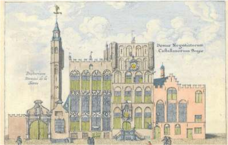
Casa de la nación de España en Brujas (1641).

También a los castellanos les ofrecieron un lugar para su asentamiento en su calle en el artículo 37 de su carta de privilegios: “Item. Se les prometió comprar y darles la casa situada en su calle, perteneciente a Gómez de Soria, junto a otras pequeñas casas, para que los de la nación hiciesen una casa y capilla honestas y honorables a su placer”.