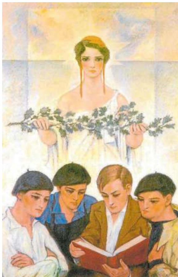
'La República Vasca'.