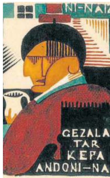
Ex-libris 'Ni naiz Gezala'tar Kepa-Andoni-na'.