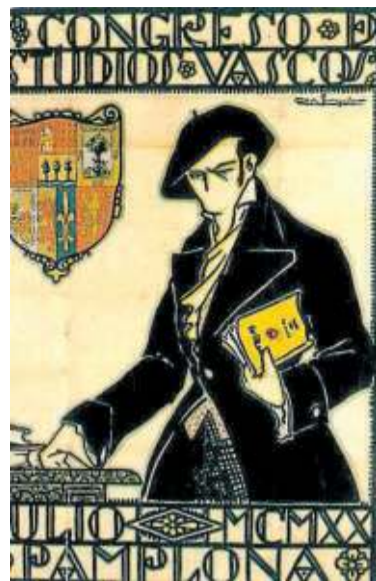
Cartel del Congreso de Estudios Vascos. Pamplona (1920)