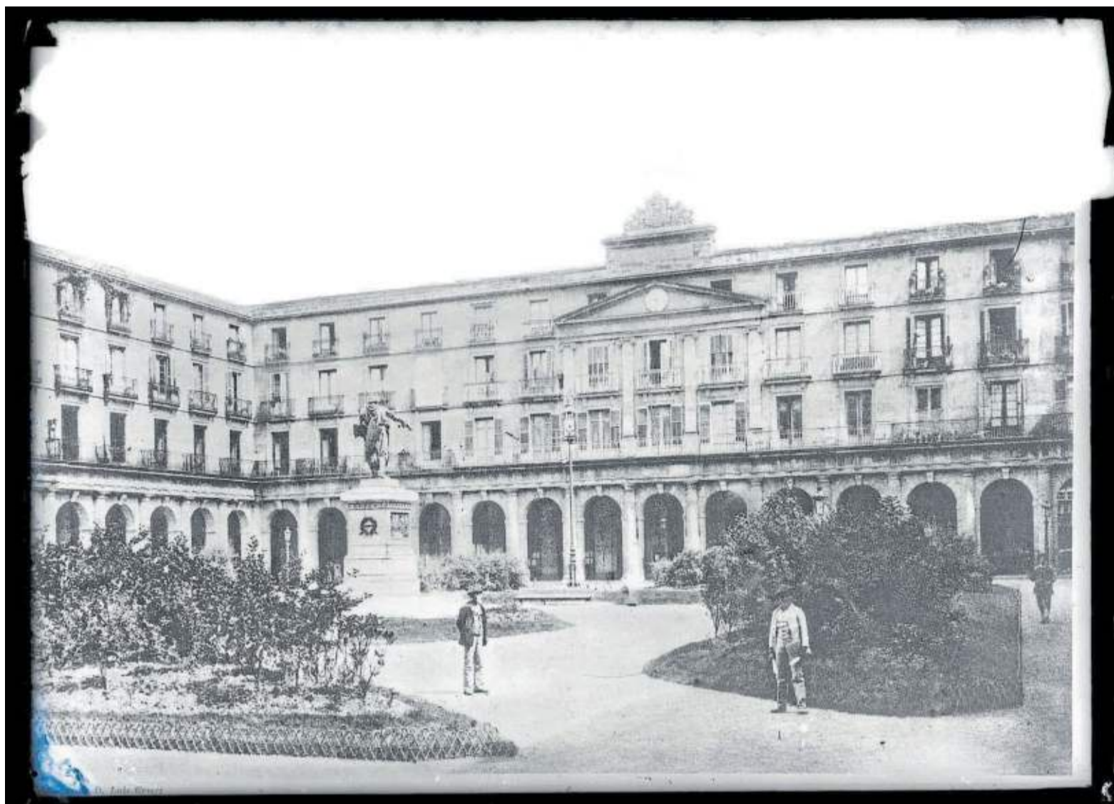
Sede de la Diputación Foral de Vizcaya en 1899 en la Plaza Nueva de Bilbao donde se reunió la Comisión.

Q UINIENTOS años después, Bizkaia está celebrando este año la entrada en vigor del Fuero Nuevo de 1526. En diferentes actos se ha recordado que este texto legal de hace cinco siglos sigue siendo un texto emblemático para recordar una tradición de pacto y autogobierno, así como de libertades públicas de alto nivel que posibilitaron la convivencia no siempre fácil de los vizcaínos a lo largo de la historia.