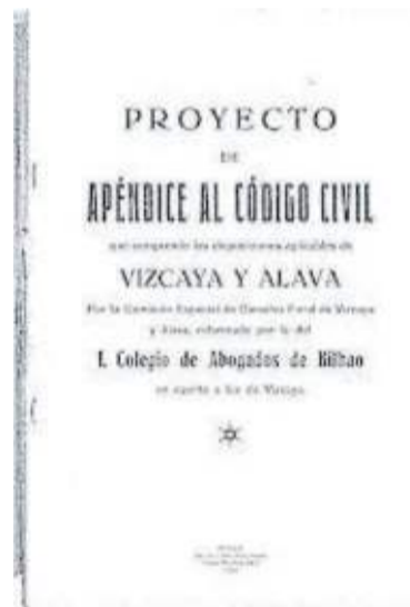
Portada del texto del Proyecto de Apéndice foral de 1900 con las aportaciones de 1928.

Sabino Arana protestó contra el atropello que suponía la imposibilidad de negociar el texto civil foral con el Gobierno Central