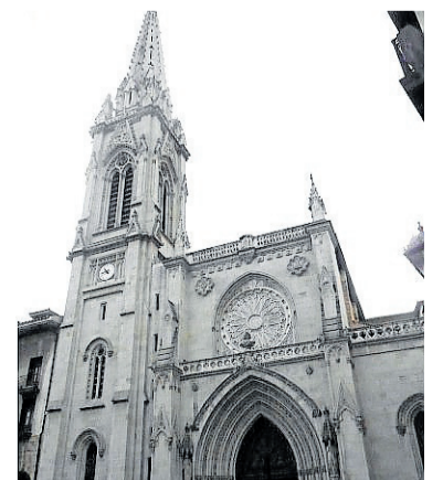
Catedral de Santiago.