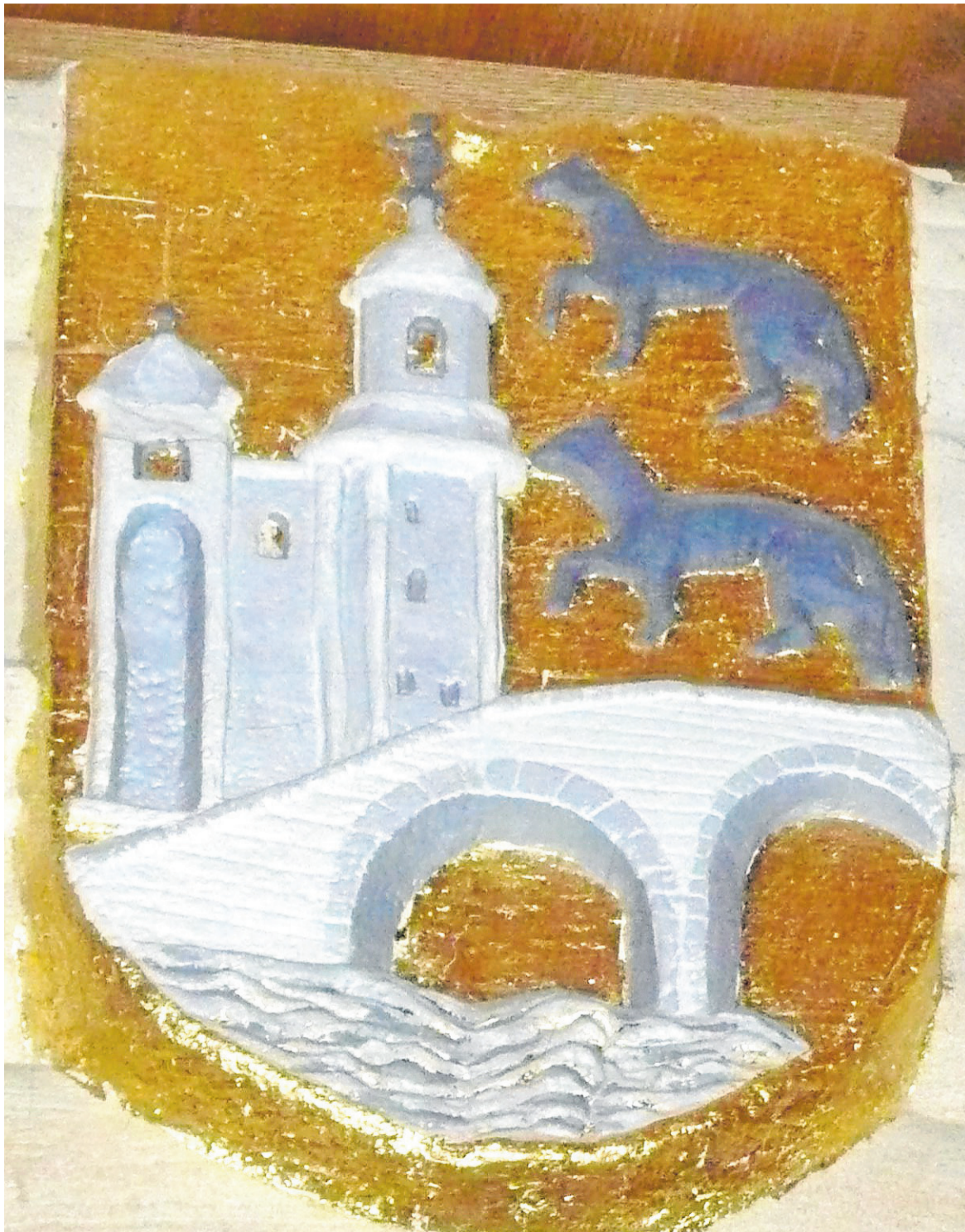
Escudo de la villa de Bilbao representado en el interior de la catedral de Santiago.

A partir de 1300 se modificó el poblamiento en Bilbao. Se urbanizó el espacio sito entre la iglesia de Santiago y el Puerto conforme a modelos coetáneos y se levantó una lonja en Bilbao La Vieja para almacenar hierro. Estos cambios potenciaron el comercio internacional desde el puerto de Bilbao involucrando en su dinámica a mineros, dueños de ferrerías –linajes de caballeros–, mercaderes y transportistas caste-