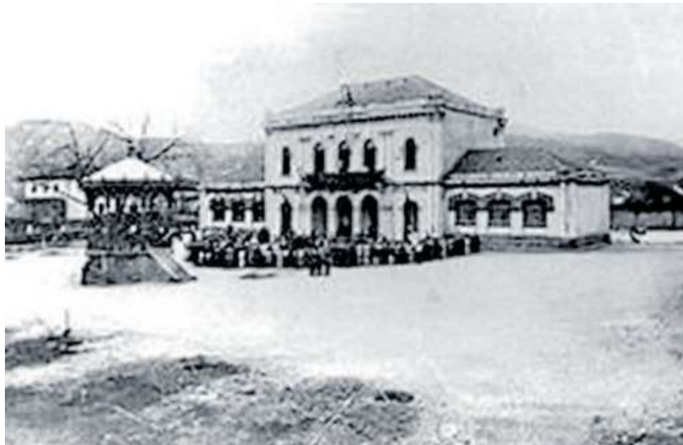
Ayuntamiento de la anteiglesia de Deusto.

jurisprudencia al respecto, todavía no hay, a día de hoy, una investigación sobre la utilización de los mecanismos del Derecho foral entonces en vigor en ambas poblaciones.