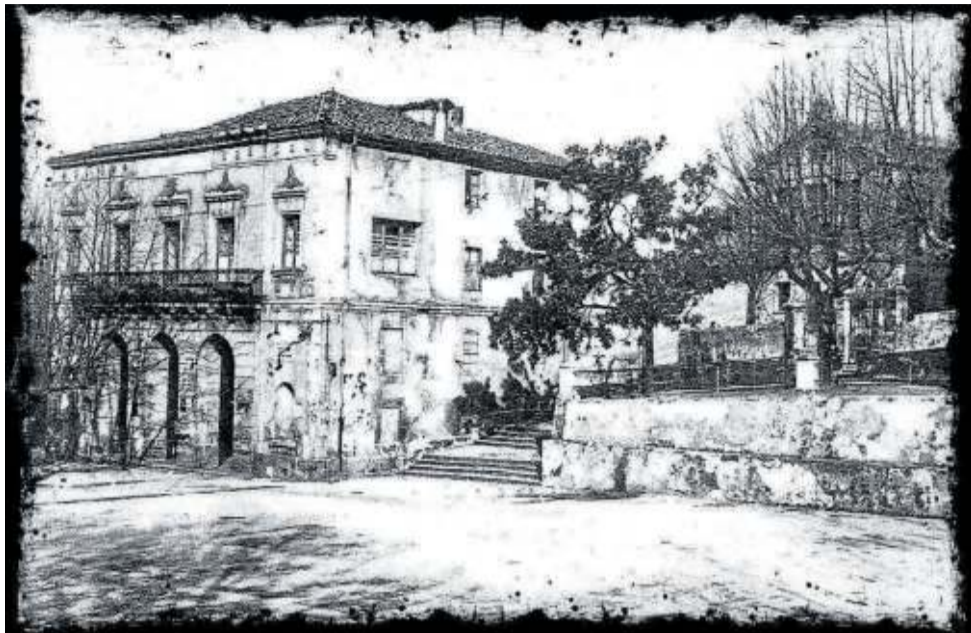
Ayuntamiento de la anteiglesia de Begonia.