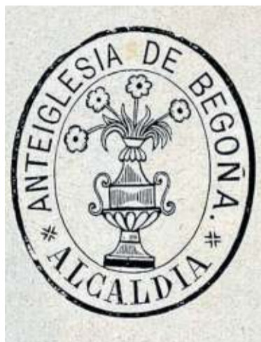
Sello de la anteiglesia de Begoña (1915).