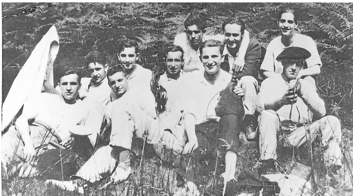
Jóvenes nacionalistas de Aramaio, ente ellos 'Lurgorri', en la cima del Tellamendi.

por el sindicato de estudiantes vascos Euzko Ikasle Batza.