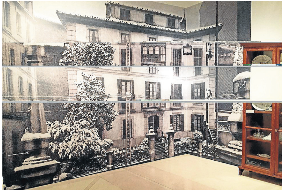
Sabin Etxea, euskal abertzaletasunaren sortzailearen jaiotetxea.

S ABINO Arana Goiriren jaiotza 150 urte dela eta ekimen desberdinak burutu ohi dira urtean barrena. EITBn, dokumental berria eta Sabin izeneko dokudrama. Euskaltzaindiak Sabino Arana Fundazioarekin batera Jardunaldia, Hermes aldizkariak 50 ale berezia eta oraingoan Bizkaiko Foru Aldundiko Bizkaikoa erakundeak antolatu berri du erakusketa zabala, Askatasun eguzkia lelopean. Jaiotzaren ehungarren urtean, Bizkaiko Aldundi probin-tzialeko aldizkariak, Vizcaya izenekoak, frankismo garaian ere gogoratu zuen, hainbat irudi tarteko, J.M. Areilzaren ikuspegiaren bidez. Bere alde, Sabindar Ba-tzak 1965ean lan osoak argitaratu zituen Buenos Airesen. Oraingoan, erakusketa atal batean, zein edozein etxetik, Sabino Aranaren lan osoak eskuragarri ditugu. ( www.sag150.eu ). Erakusketa antolatzeko unean, pertsonaiaren osotasunaren baitan bi ezaugarri hartu ditugu ardatz: Euskaltasuna eta ekintzabide politikoa.