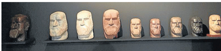
S. Aranaren buruak, J. Oteizak egina.