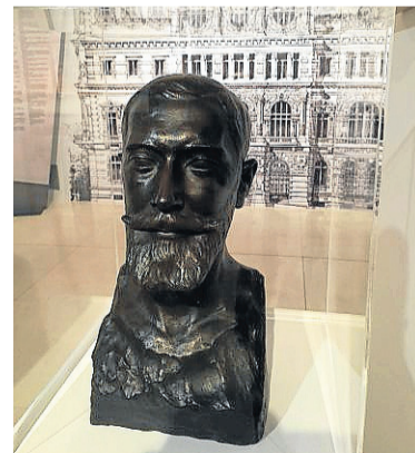
S. Aranaren burua, 1919an L. Fernandez de Vianak egina.

Bere bizitzan barrena argitaratu zituen liburu eta liburuxka guztiak erakusten dira. Adibidez, 1896. urteko apirilak 12an Ereñon Espainiako parlamenturako hauteskunde egunean labankadaz J. A. Arrizabala hil zuten eta bere omenez eta