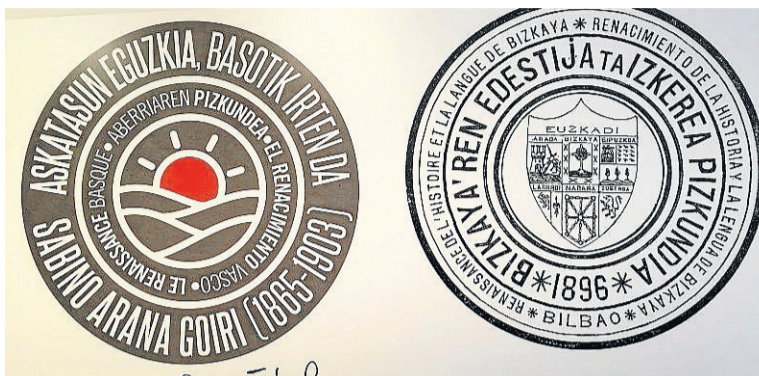
Erakusketaren iragarkia eta Arana anaien argitaletxearena (1896).