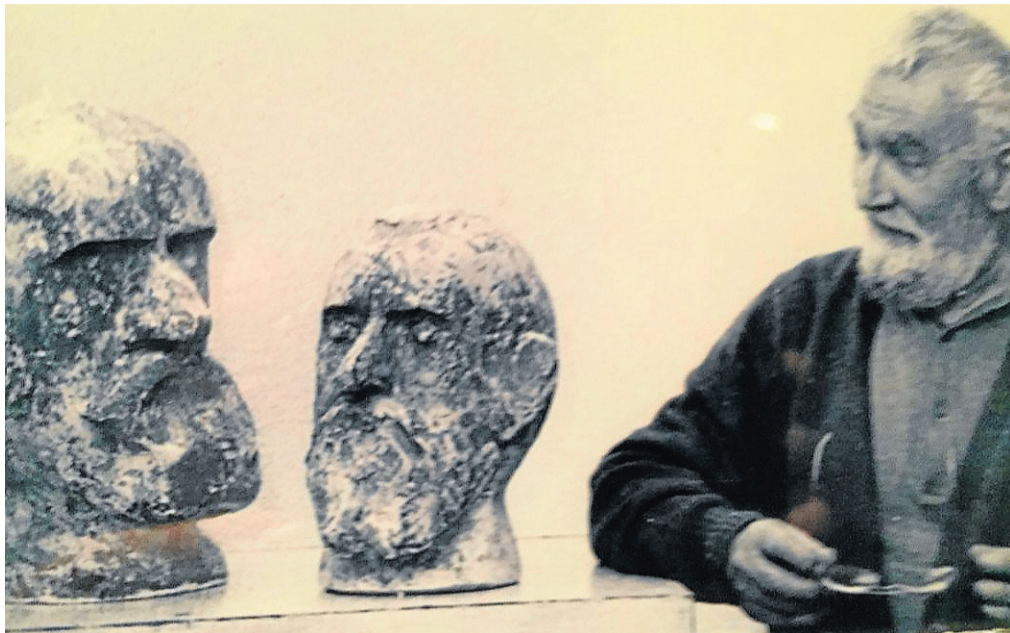
Jorge Oteiza eta Sabino Aranaren buruak (1979).